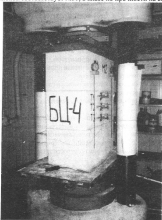
Рисунок 1 – Фрагмент кладки из газобетона марки по плотности D400, подготовленный для испытания на центральное сжатие.

12. Марка блоков соответствует М35, а класс прочности на сжатие В2,5.